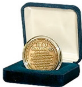
Moneda de los 10 Mandamientos (de lujo)