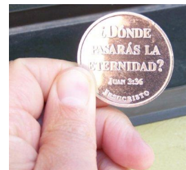
Moneda ¿Donde pasarás la eternidad? (Juan 3:16 por detrás)