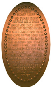
El centavo con Los Diez Mandamientos